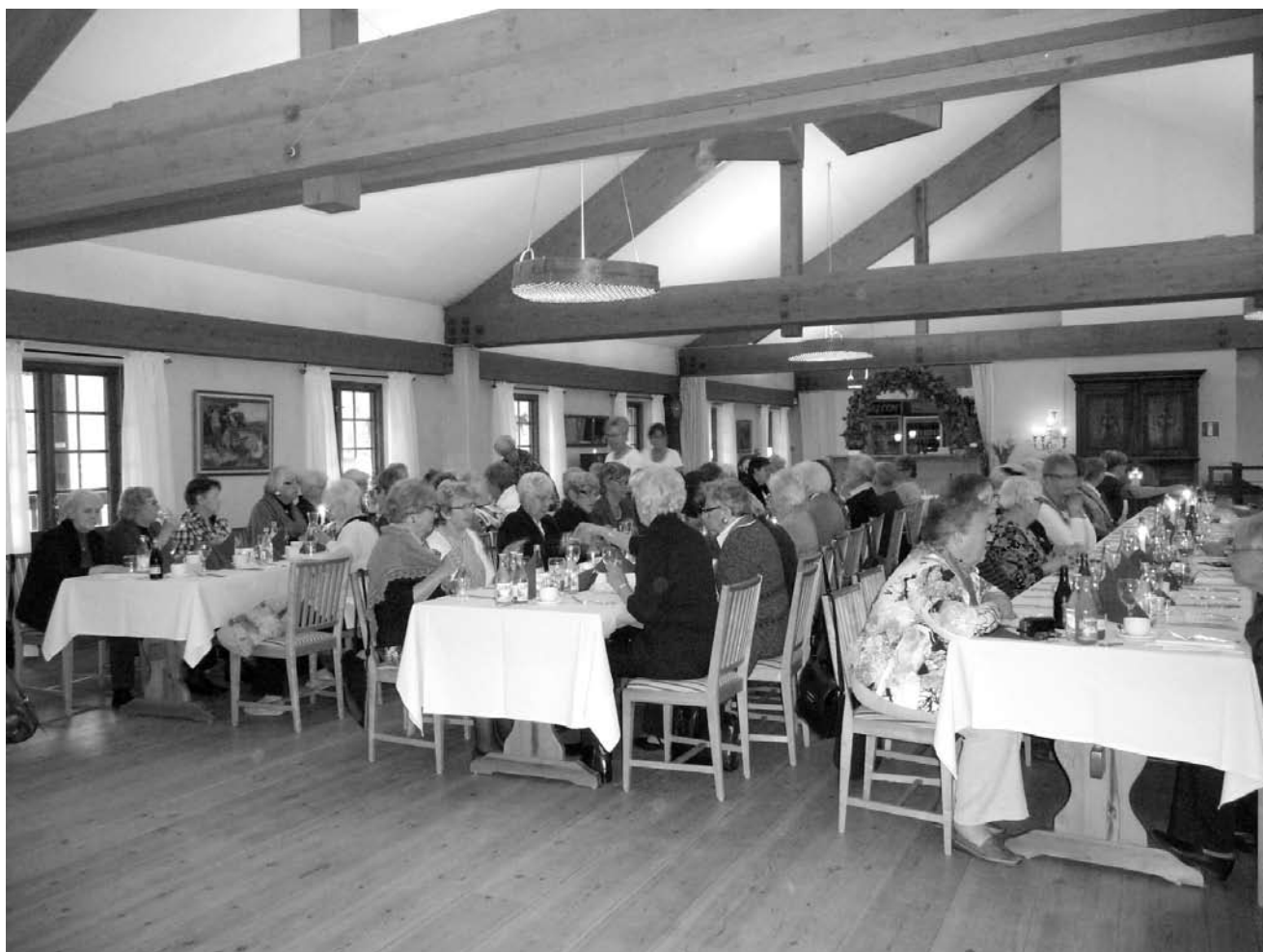
Husmodersföreningens 60-års jubileum på restaurang Skutbouden

Vi har en fin gemenskap i Vävstugan på tisdagarna och du är hjärtligt välkommen dit mellan kl. 09 och 13.