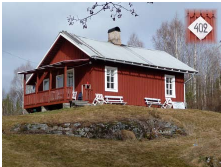
Banvaktstugan i Stora Skärmnäs 2012.

Det fanns ytterligare åtta banvaktstugor fram till Arvika. Edane hade två stycken, en öster om stationshuset på andra sidan vägen och den andra vid nuvarande brandstation. Inte heller Gryttoms och Ingerbyns finns kvar, däremot Nytorps banvaktstuga. Myroms är en av de få som bebos permanent, även nu som konstnärsbostad. Skansen, mitt för Mötterud och den vid Lycke finns inte kvar. Däremot den sista före Arvika station vid Sägudden, som är nummer 410 och även den bebos året om.