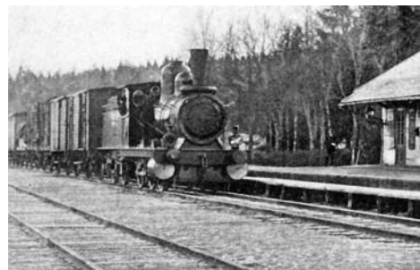
Ånglok vid Brunsbergs station omkring 1900.