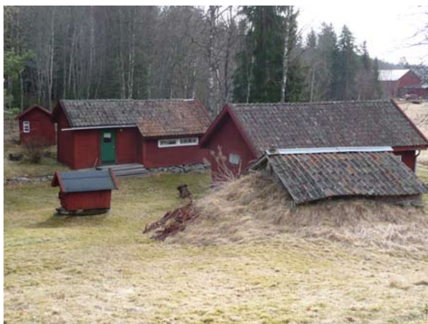
Banvaktstugans uthus 2012.