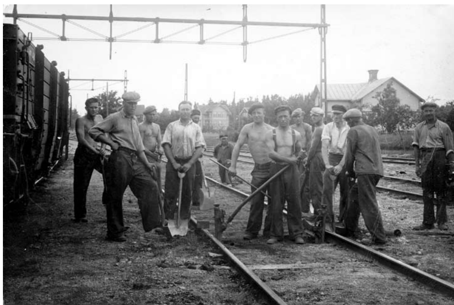
Rallargänget under förstärkningsarbetet i samband med elektrifiering av banan.

Min mor uttryckte med förvåning – ”Gräs, så kan väl ingen heta? Det skall allt bli roligt, att se hur en sån person ser ut!”