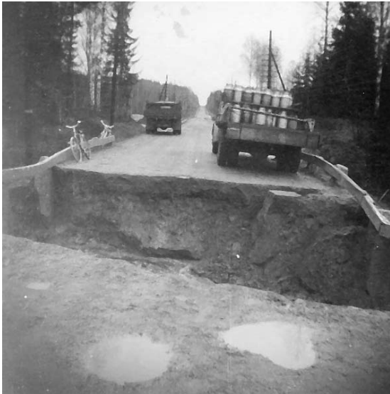
Vart tog vägen vägen?