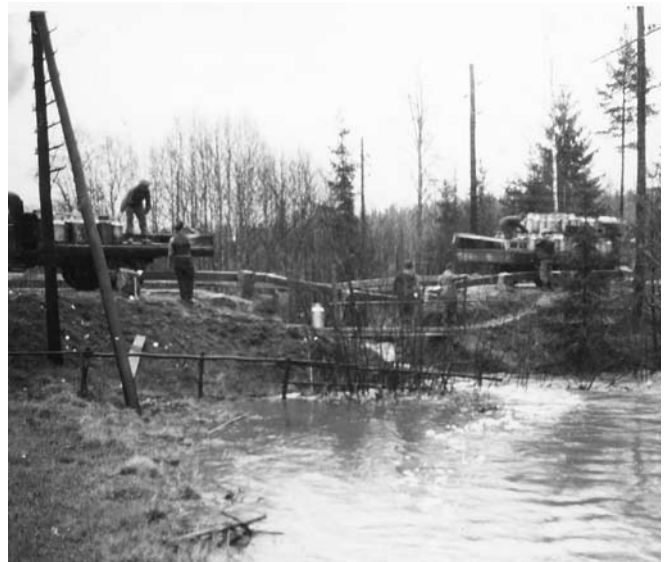
Omlastning med handkraft av mjölkflaskor.

Var och när inträffade denna katastrof. Svar sidan 19.